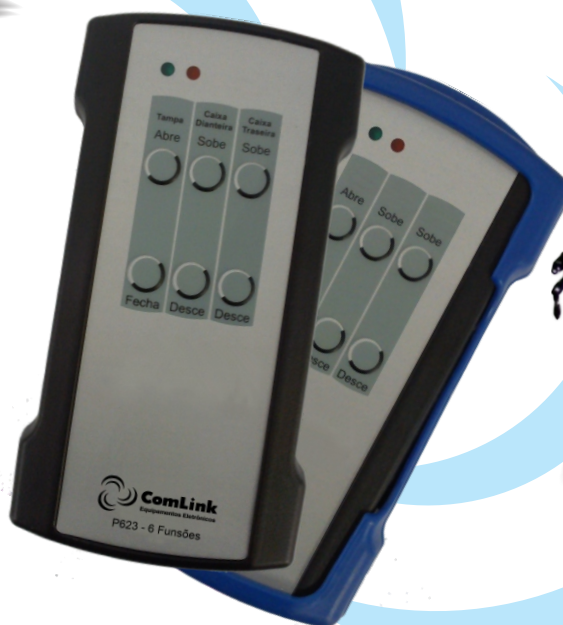
Hidráulica / Pneumática